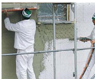
Наружные штукатурные работы