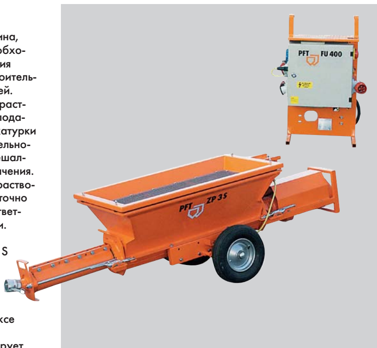
PFT ZP 3 S FU 400 с большим загрузочным бункером.

При работе в комплексе с миксером датчик заполнения контролирует уровень раствора в загрузочном бункере.