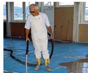
Наливные бесшовные полы