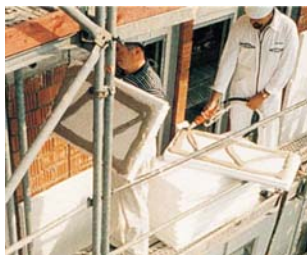
Нанесение клеявого раствора